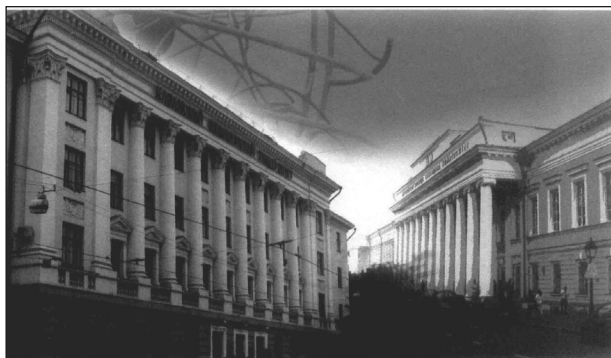
Казанский императорский университет с медицинским факультетом, основанный в 1804 г. (справа), и Казанский государственный медицинский университет (слева), существующий как самостоятельное медицинское высшее учебное заведение с 1930 г.