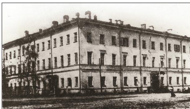
Клиника медицинского факультета Казанского императорского университета – «старая клиника» (основана в 1869 г.)

В результате он подготовил и издал русскоязычные руководства по нейрохирургии: «Повреждения и заболевания покровов черепа и лица» (1902) и «Повреждения черепа» (1903).