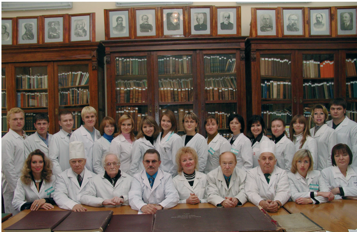
Коллектив кафедры анатомии человека СГМУ, 2009 г.